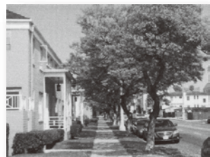
初夏の訪れを知る ジャカラランダの花が 枝いっばいに 咲く街並み