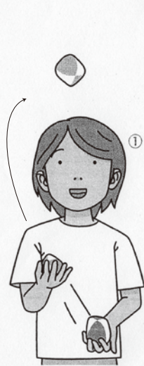
④ 右手に2個、左手に1個、お手玉を持ちます。右手のお手玉(青)を高くあげます