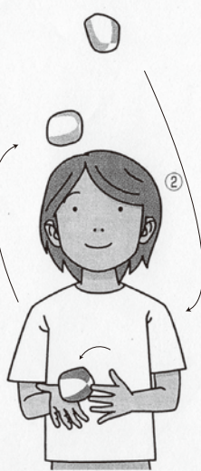
③ 続けて右手のもう1個(緑色)をあげます。このとき左手のお手玉(赤)を右手に送ります。視線は上げられているお手玉から離さないように