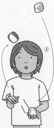
② 左手で最初のお手玉(青)を受け取り、ほぼ同時に右手でお手玉(赤)を投げあげます