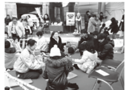
お手玉遊びの技を指導 みんなで遊べる遊びを楽しみました。