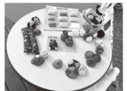
お手玉コーナーに展示