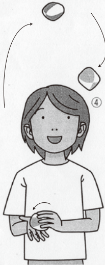
① 左手のお手玉(青)を右手に送り、お手玉(緑色)を受け取る準備をします。あとは繰り返しです

協力 日本のお手玉の会 愛媛県新居浜市泉池町10-1 銅夢にいほま内 ☎0897・32・0302