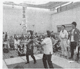
競技大会団体戦の様子。競技時間は1~2分間。赤い布が競技場で、足が出ると失格です

DATA お手玉 ①945円(3個)・3,528円(12個) 購入方法: シンクオンラインショップにて通信販売 (http://sinkingthinking.co.jp/shop/)