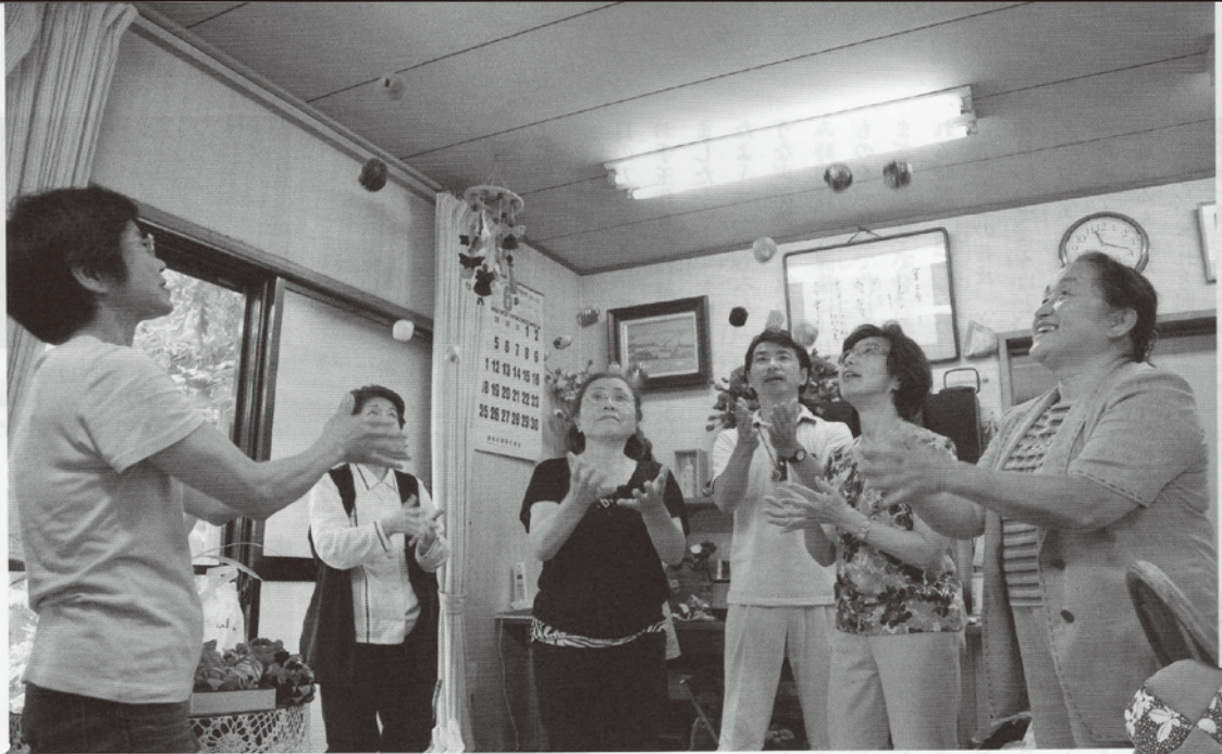
歌いながら踊り、お手玉の技を見せる「お手玉演舞」の練習の様子。この日、歌われていたのは「アルプス一万尺」。数少ないという、男性会員さんも生き生きと参加していた。

「お手玉のある場所には みんなの笑顔があつて、 人のぬくもりがあつて、 新しい出会いがあるの」