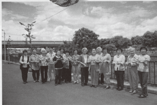
雲子さん（右から4番め）と東京支部の皆さん。世田谷区周辺に住む方たちを中心に、総勢20人くらいの会員がいるそう。皆さん、明るく、元気。お手玉への愛と情熱にあふれていた。

子さんのもとに、全国展開するから参加してくれないかとお誘いがあったのです。「最初、お声がかかったときは、「はい。わかりました」って、わりと冷静にお答えしたのね。地元で貢献できるならって。それがね、後からちりめんのお手玉が5つ送られてきて。それを見たらね、もう、だめめろめろ。お手玉の思い出が、一気によみがえったの。そのきれいな5つのお手玉は、大切にしまいい込んでいたら、全部やられちゃった、虫に。きれいに食べべになつて。もう、悲しかったわあ」