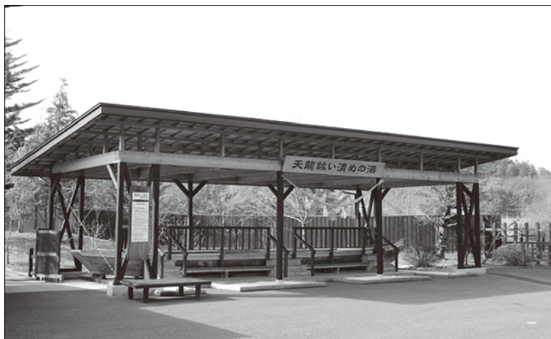
■【足湯】天龍祓い清めの湯