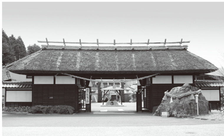
■伊那谷道中かぶちゃん村の入口「長屋門」

〒792-0013 愛媛県新居浜市泉池町10番1号 TEL : 0897-32-0302 FAX : 0897-32-0311