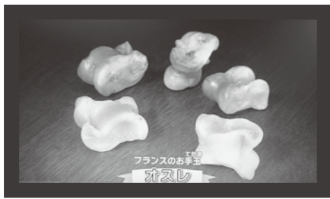
■ フランスのお手玉 (羊の骨) オスレ