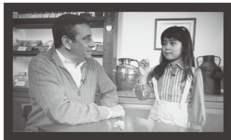
■ フランスの料理人がお手玉遊びを説明