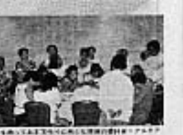
新居浜市からお手玉の会が来訪し、現地の人々と交流しました。

今回の来訪は、両国間の友好関係を深める貴重な機会となりました。お手玉の会では、今後も海外への出張講習を積極的に行っていく予定です。