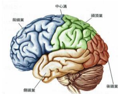
図2 大脳皮質表面における葉の分類

ここでは、もう少し前頭前野のことに触れたいと思います。その前にまず、脳全体を知っておい